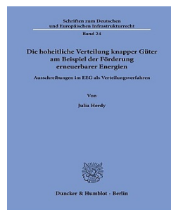
› Die hoheitliche Verteilung knapper Güter