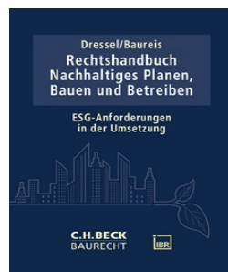
› Rechtshandbuch Nachhaltiges Planen, Bauen und Betreiben